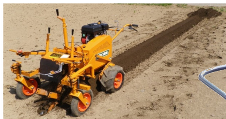
▲栽培床づくり作業(※旧機種) ※安全ガードは撮影のため外しております。