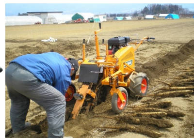
▲掘取作業(※旧機種) ※安全ガードは撮影のため外しております。