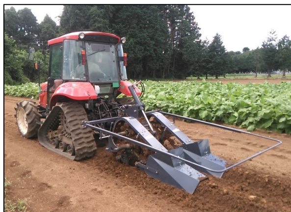
▲栽培床づくり作業(※整畦板はオプション)