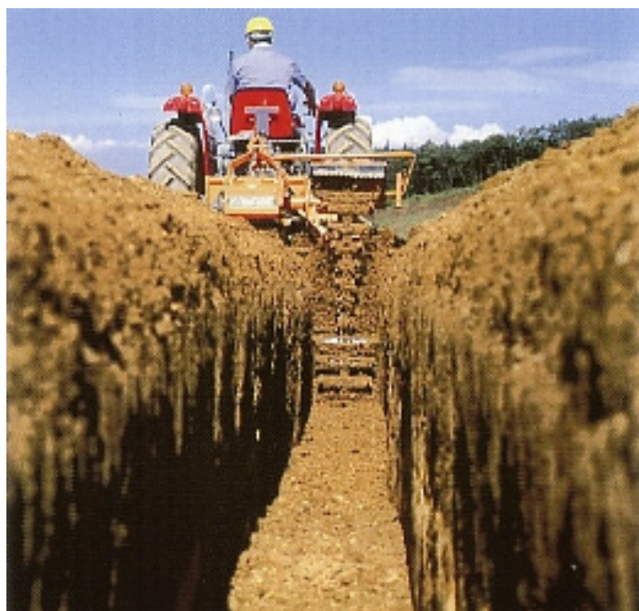
▲溝掘り作業(F仕様)(※旧機体色)