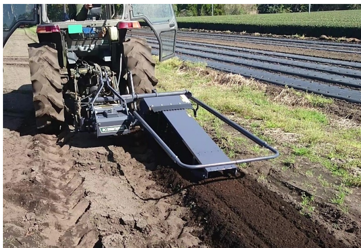
▲栽培床づくり作業(R仕様)