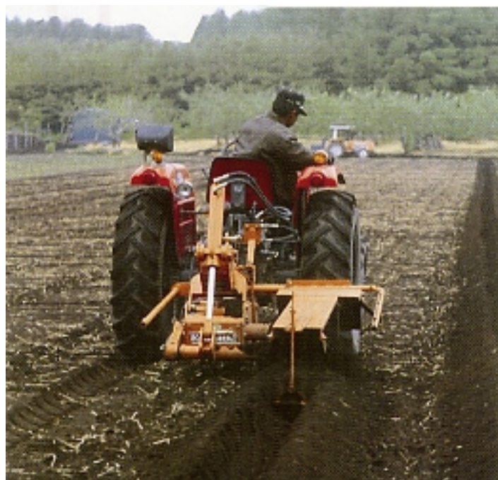
▲栽培床づくり作業(R仕様) (※培土板はオプション,旧機体色)